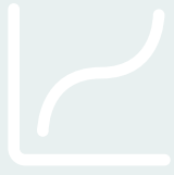
Profit en fonction du prix de revente mutualisé d'un arbre à la coupe (max. 10 ans)